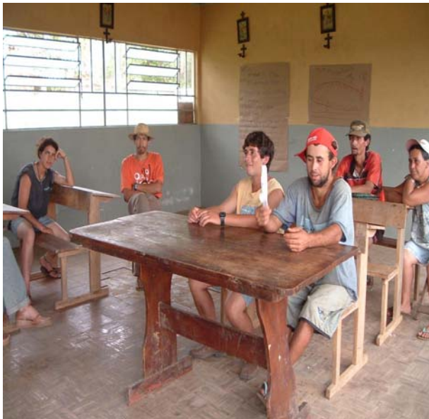
Figura 3 Assentamento de Canoinhas SC