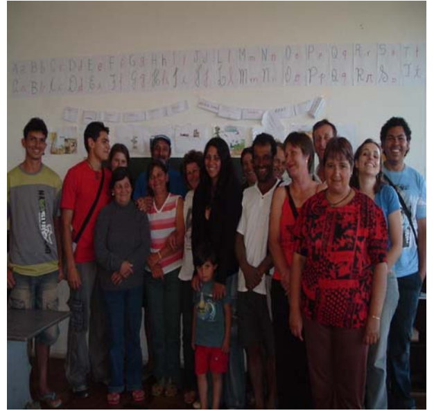
Figura 2 Assentamento Morro do Taió