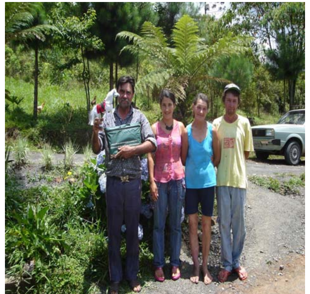
Figura 4 Assentamento Rio dos Cedros (educando homenageado)